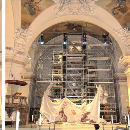
Den stora ställning som varit för två års kontroller blir synlig.