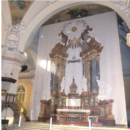
Vi beskådar den fina bilden och väntar...på nedhissning